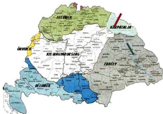
Рис. 3. Угорщина часів Бояї. Суцільна стрілка вказує на батьківщину Бояї, а пунктирна стрілка – на Ужгород (Ungvár), місце першої зустрічі БГЛ у 1997 році. Сьогоднішня Угорщина показана білим кольором

Незважаючи на поради батька, Янош продовжував свої зусилля, і в 1824 р. вивів співвідношення між довжиною перпендикуляра і кутом асимптоти. “Я створив світ із нічого”, – заявив він батькові. Можна побачити з його рукописів, ескізів та листів, що вже в 1820 р. він був на правильному шляху до розгляду границі великого кола. Більша частина виконаної Яношем Бояї роботи залишилася неопублікованою. Рукописи можна знайти [5] у бібліотеках і музеях, наприклад, у Морощвашаргеї.