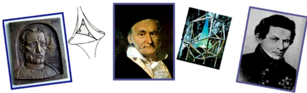
Рис. 1. Я. Бояї, Й.К.Ф. Гаусс та М.І. Лобачевський